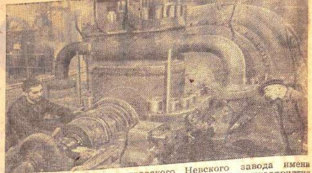
Машинистры ленинградского Невского завода имени В. И. Ленина оснащают металлургические предприятия сборочно-монтажным цехом изготовлена паровая турбина в 22 тысячи киловатт, предназначенная для вращения самого мощного компрессора на Криворожском металлургическом заводе. Вы видите ее на снимке.

Советские литераторы и деятели искусств всегда были и будут вместе со своим народом, со своей партией. У них не было и нет более возвышенного идеала, чем служение своему народу и Отечеству. От вдохновляющего слова партии на сердце у нас стало теплее и светлее, приблизилось сил, легче стало думать и писать.