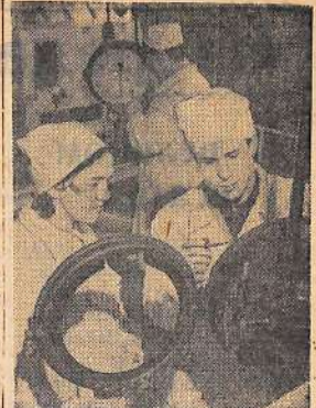
Молодое предприятие Тагарни — казанский завод «Теплоконтроль»...