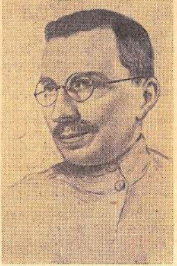
впервые поделился со мной своим замыслом.

быть в действии, и посмотрите, какие хорошие, загорелые хлопцы и девчата растут у нас. Знаете, я напишу поэму о нашей колонии. Это будет педагогическая поэма. Вы думаете, не может быть педагогической поэмы? Я наверно и запомнила на всю жизнь этот сияющий рабочий летний день потому, что тогда Антон Семенович