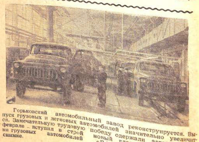
Горьковский автомобильный завод реконструируется. Выпуск грузовых и легковых автомобилей значительно увеличился. Замечательную трудовую победу одержали автозаводцы. В феврале вступил в строй новый главный конвейер сборочных грузовых автомобилей «ГАЗ-53Ф». Он показан на снимке.

Другой пример. В колхозе имени Чапаева орошаемые земли не увеличиваются. Однако каждый год возрастает план посадки махорки. А эта культура требует