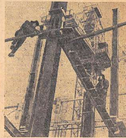
В пятом году семилетки и первый турбоагрегат Беловской ГРЭС даст ток в колхозные системы Кузбасса. На электростанции и идет сборка мощной турбины котла. На снимке: монтаж котла.