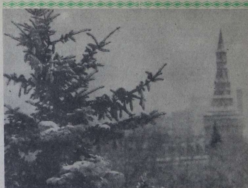
В КРЕМЛЕВСКОМ САДУ ЗИМОЙ

8.00 Спорт для всех. 8.20 Тираж «Спортлото».