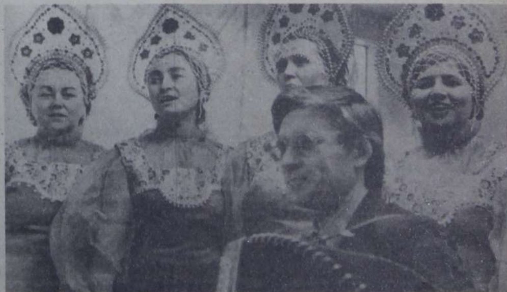
Участники художественной самодеятельности поликлиники № 2