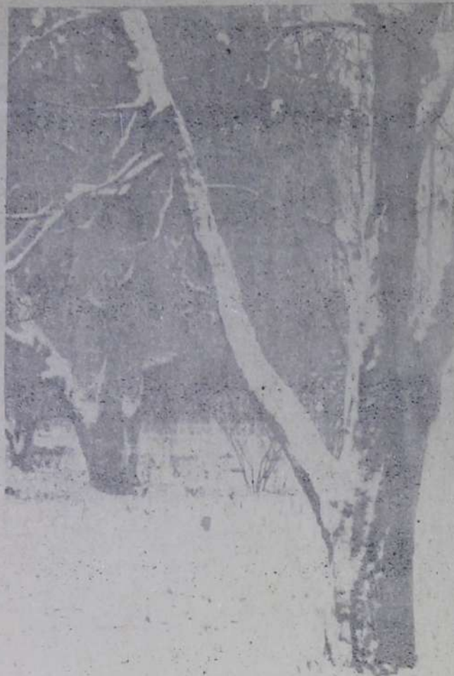
ТИХО В ЛЕСУ.