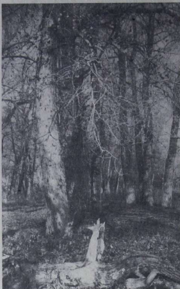
РОНЯЕТ ЛЕС БАГРЯНЫЙ СВОЙ УБОР.

Обращаемся к жителям города с просьбой оказать помощь в установлении места нахождения мальчика. Сведения сообщить по телефонам: 9-28-01, 4-43-10 или 02.