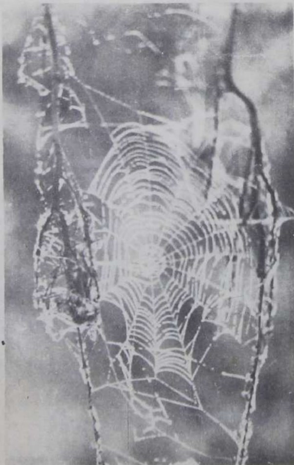
ОСЕННИЕ УЗОРЫ.

Обращаться в отдел кадров ПАТП, проезд автобусами №№ 1, 10, остановка «Гараж». Справки по телефону 4-60-91.