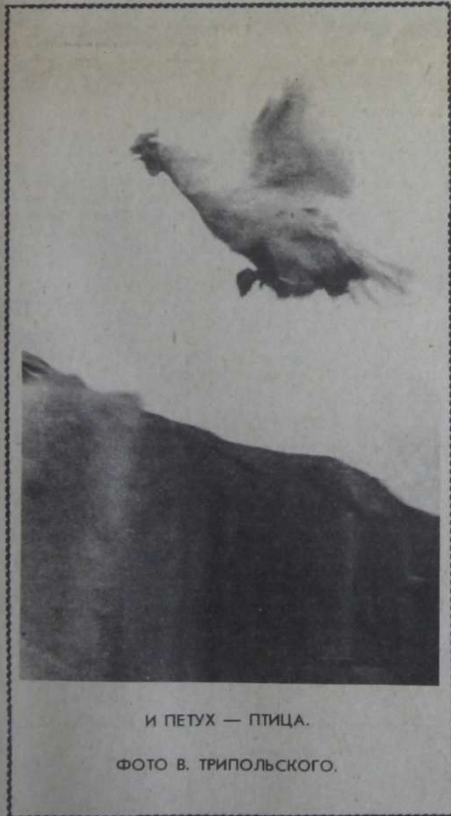
И ПЕТУХ — ПТИЦА.