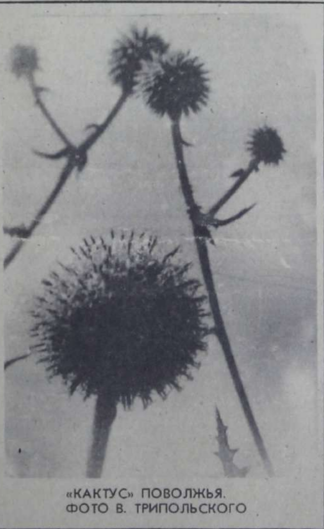
«КАКТУС» ПОВОЛЖЬЯ.

От Балакова кроме двух команд нашего клуба «Синя птица» и «Колос» участвуют команды объединения «Хим