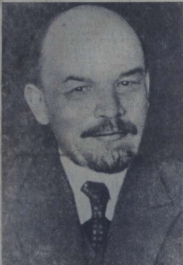
В. И. Ленин. (Фрагмент фотографии 1924 г.).

Сегодня исполняется 118-я годовщина со дня рождения В. И. Ленина