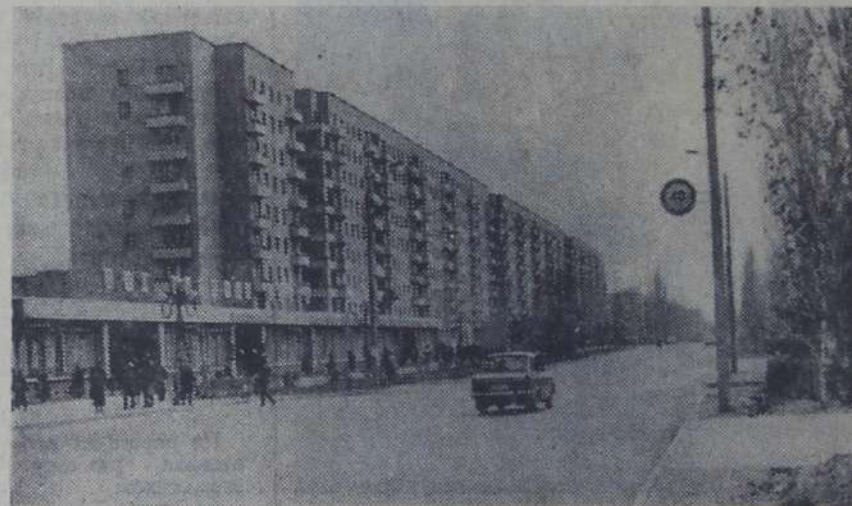
Старожилы помнят улицу Новоузенскую, которая сегодня носит имя Ленина, грязной, немощеной. В дождливую погоду на дороге вязли телеги, по ступицу уходили в грязь колеса. А сегодня улица Ленина — современная магистраль, одна из красивейших в нашем городе.