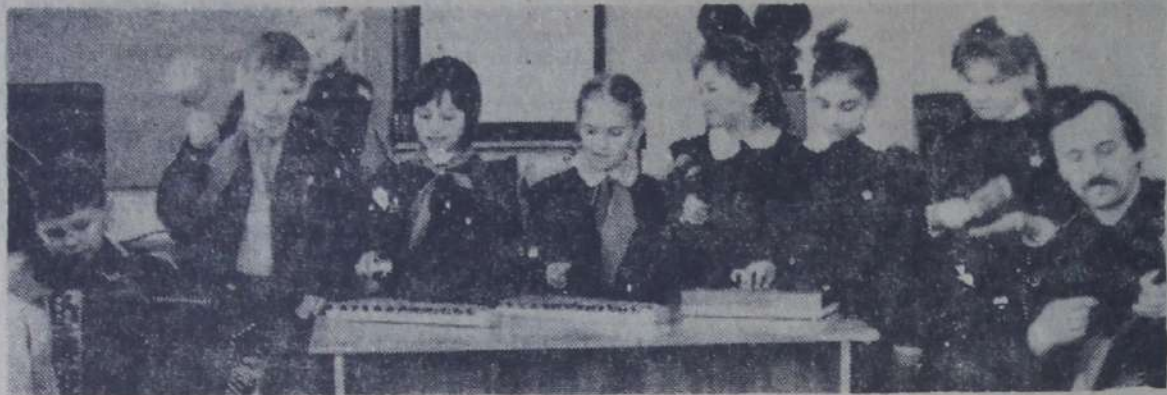
В школе № 25 открыт специальный музыкальный класс. Здесь имеются необходимые инструменты: баяны, фортепиано, балалайки, гитары, саратовские гармоники, стереоаппаратура.