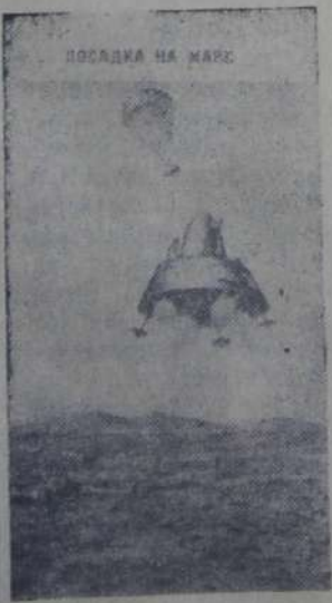
Москва. Институт космических исследований АН СССР. Большой интерес представляет советский проект «Фобос».

бос», по которому в июле нынешнего года намечается полет к Марсу двух летательных аппаратов. Двести дней спустя они станут спутниками планеты и будут проводить ее исследование. «Марсоходы» и возвратные ракеты, посадочные аппараты нового поколения и аэростатные зонды запланированы программой советских исследований. 400 миллионов километров разделяют Землю и «Красную планету». Ее дальнейшее изучение будет новым шагом советской космической науки.