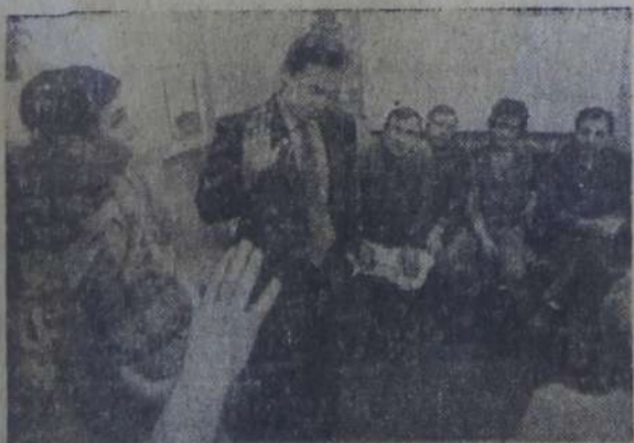
МОСКВА. О человеке судят не по словам, а по делам. Секретарь партий-

ного комитета второго механосборочного корпуса производственного объедине-