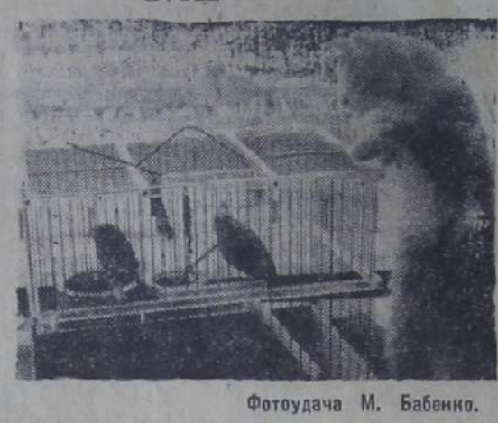
Фотоудача М. Бабенно.