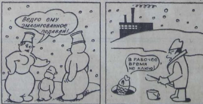
Рис. В. Дмитриева.