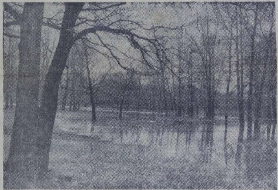
В осеннем лесу.

Нечасто встречаются дни, Где встретишь рождение мечты Постычь все я не успеваю А он мне мигает в ответ. «Не боги горшки обжигают», — Лукаво заметал мне дед.