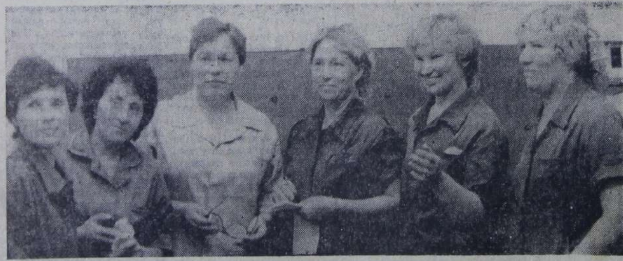
При остановке машина на профилактический или текущий ремонт их следует очистить, снять гарнитуру, а после ремонта — подготовить к работе. С этой задачей отлично справляется коллектив сменщиков гарнитуры, который работает в прядильном цехе кордного производства № 3 объединения «Химволокно».