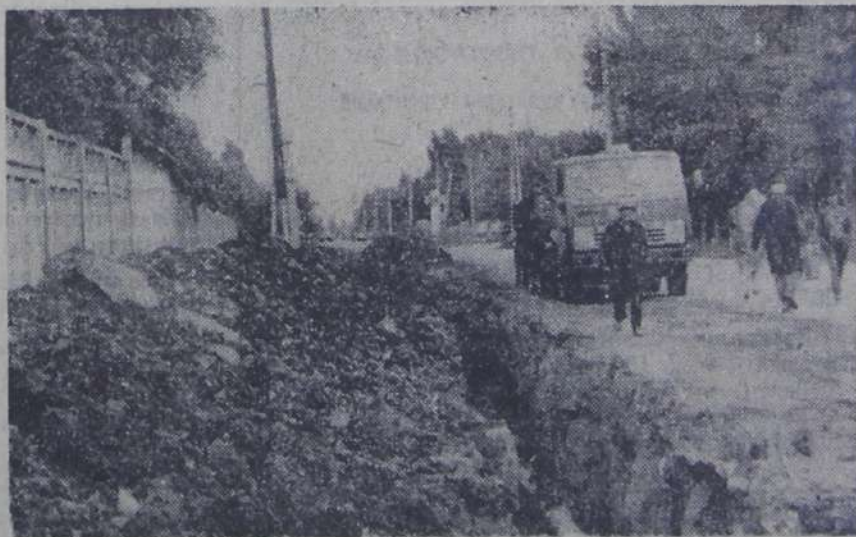
Работы на канализационном коллекторе проводились мясокомбинатом.

Хотим знать, когда, наконец, организация, отвечающая за порядок и состояние дороги, примет меры? О. ОРСИНА и др. Всего 11 подписей.