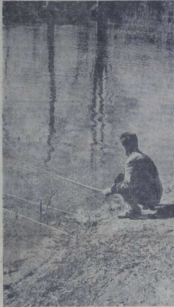
Чтобы отведать ухи, совсем немного надо: терпение, умение и везение.