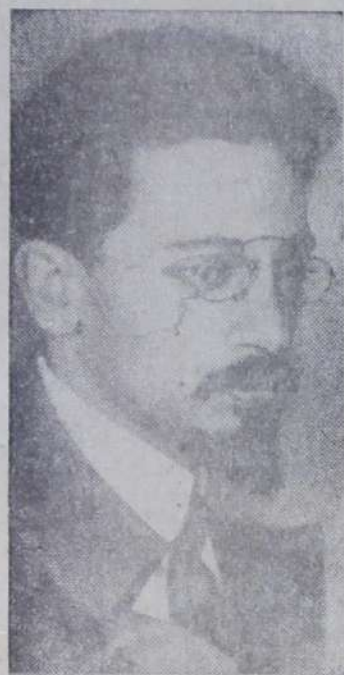
Я. М. Свердлов (1885—1919 гг.).

4 июня — 100 лет со дня рождения Я. М. Свердлова, деятеля Коммунистической партии и Советского государства.