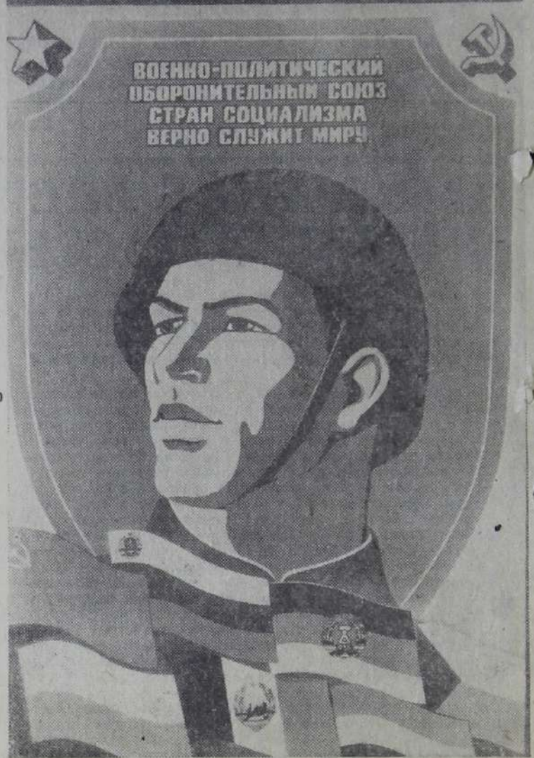
Планет художника М. Гетмана. Издательство «Планет».