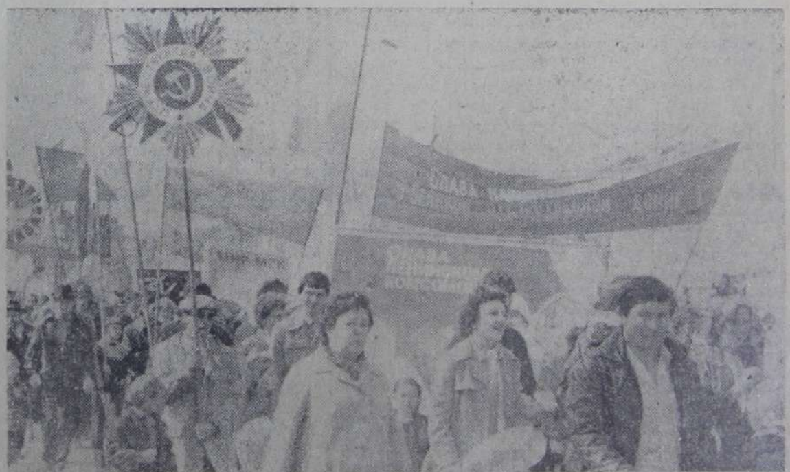
На первомайской демонстрации.