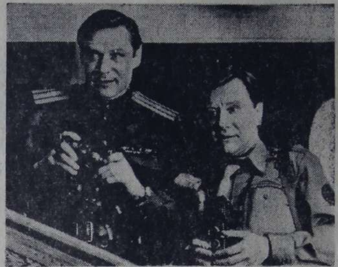
В кинотеатре «XX лет ВЛКСМ» состоялся общественный просмотр фильма режиссера-постановщика Е. Матвеева «Победа», поставленного по одноименному роману А. Чаковского.