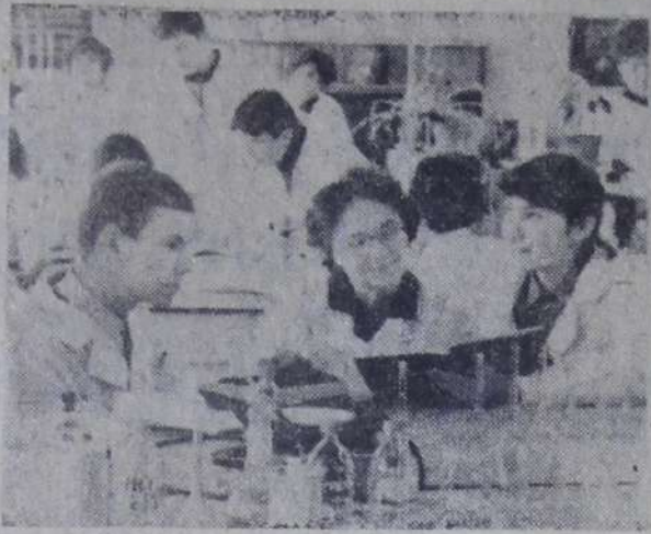
В распоряжении учащихся IV курса химико-технологического техникума имеется хорошо оборудованная лаборатория технического анализа и контроля производства.