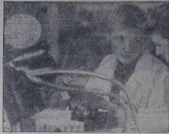
СВЕРДЛОВСКАЯ ОБЛАСТЬ. Почти восьмисот человек в Качканарском межшкольном учебно-производственном комбинате трудового обучения и профессиональной ориентации