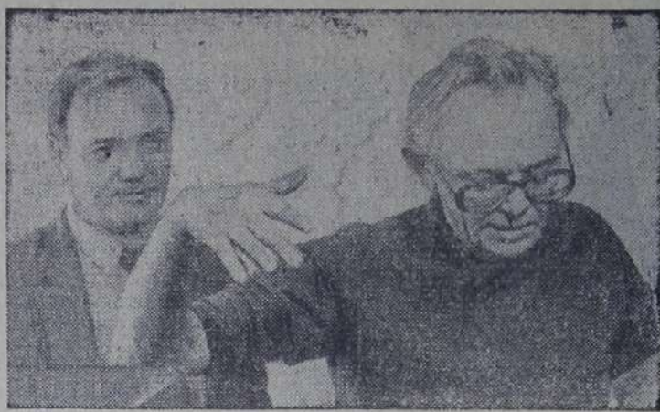
МОСКВА. На киностудии «Мосфильм» известный советский кинорежиссер Л. И. Гайдай снимает новую кинокомедию