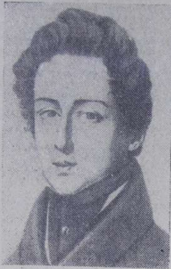
Фридерик Шопен, великий польский композитор.

К 175-летию со дня рождения Ф. Шопена (1810—1849 гг.).