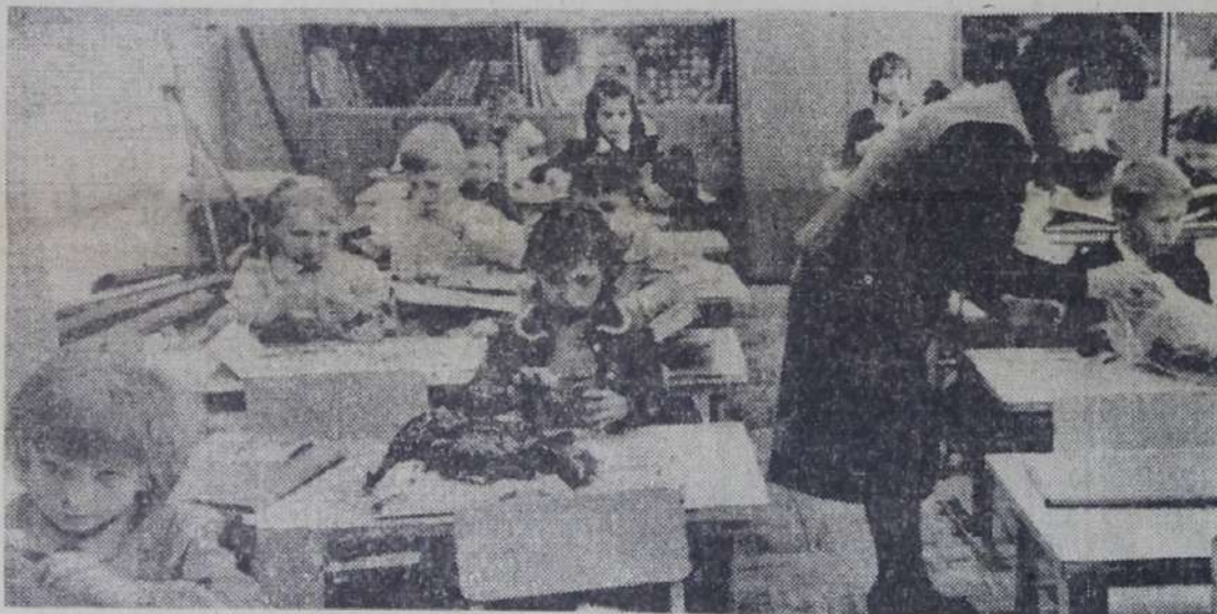
В средней школе № 23 большое внимание уделяется трудовому воспитанию учащихся начальных классов.