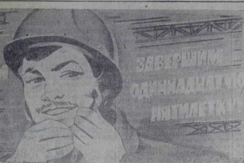
Плакат художника В. Сачкова.