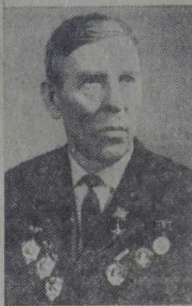
На снимке: А. Г. Стаханов.

21 декабря — 80 лет со дня рождения А. Г. Стаханова (1905—1977), зачинателя массового движения новаторов производства