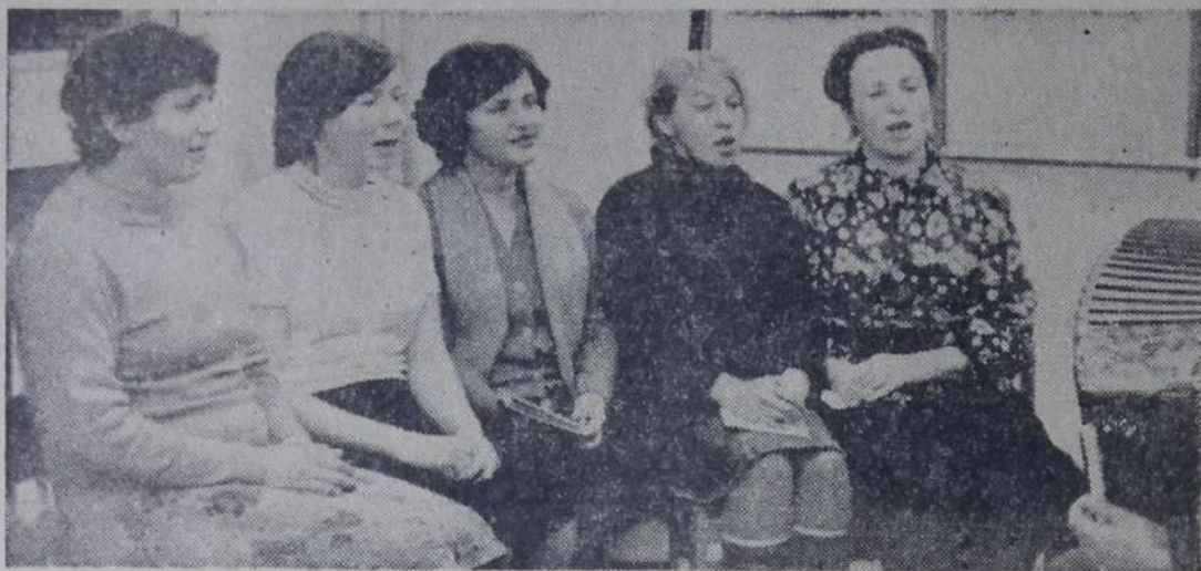
Во Дворце культуры строителей начал функционировать кружок народной песни. Его членами являются труженицы городских предпри-