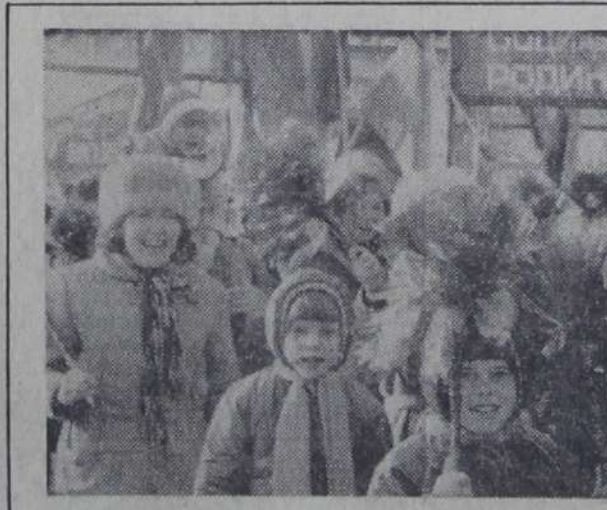
На праздничной демонстрации.