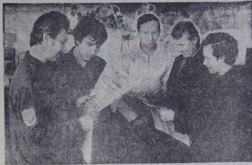
Работать по-ударному, выполнять и пятилетки в целом — так откликнулись рабочие химического завода на решения октябрьского (1985 г.) Пленума ЦК КПСС. На снимке: рабочие отдела главного

ко было выделить лучших мастериц. Все работало с большим подъемом и мастерством. И скорость работы была высокой, и качество перемотанных на бобинах нитей соответствовало гостевским требованиям. Порадо-