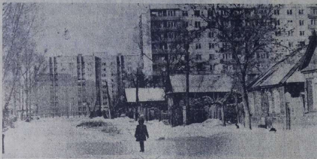
На глазах меняется облик островной части города. По титулу крупнейшего предприятия города — химического завода ведется интенсивное строительство жилья, объектов соцкультбыта.