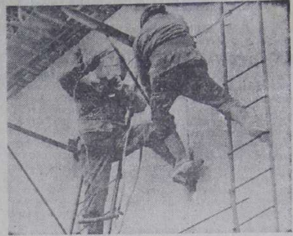
Строится Балаковская АЭС.

Труд этого коллектива, как и множества других, строящих свою работу на основе стахановских принципов, служит делу ускорения социально-экономического прогресса — достижению качественно нового состояния советского общества. А это, по словам Михаила Сергеевича Горбачева, продиктовано самой жизнью.