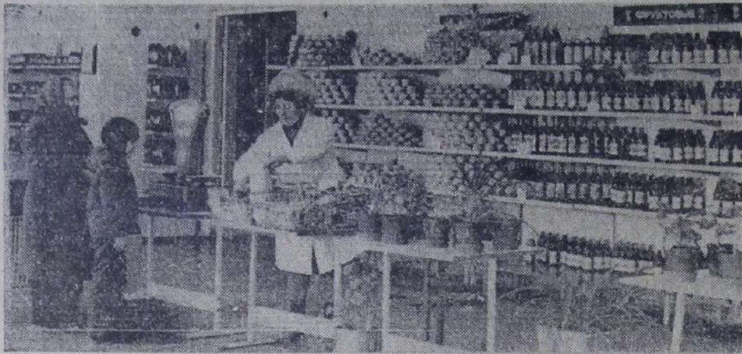
В островной части города по приказам избирателей появился новый продовольственный магазин № 69 городского торгового центра, построенный коллективом Жилстроя по титулу химического завода.