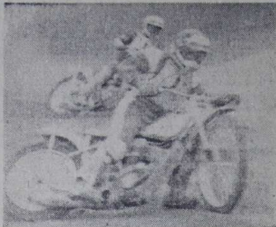
была зафиксирована ничья. А общий счет этого матча 7:9 в пользу «Турбины».

Несмотря на все усилия, гости так и не смогли выиграть ни одного заезда у наших мотогоонщиков. Лишь только в четырнадцатом опять