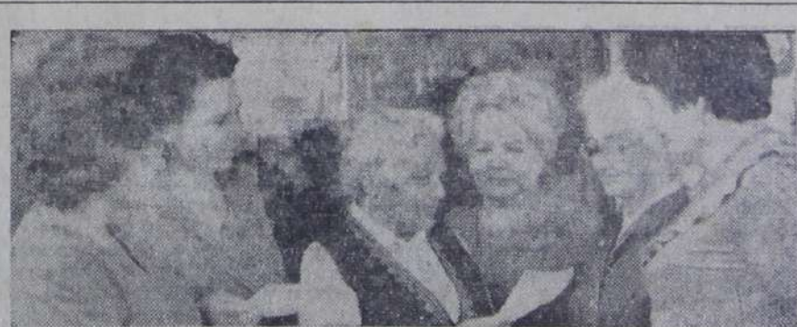
За несколько минут до начала совещания...

В ЗАКЛЮЧЕНИЕ участники большого педсовета были приняты рекомендации педагогическим коллективам.