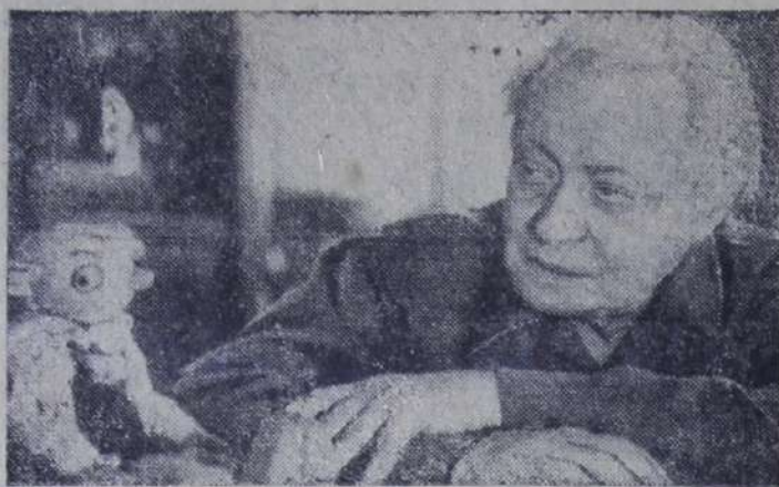
Москва. Ленинской премии за произведения литературы

и искусства для детей, за спектакли и фильмы последних лет удостоен народный артист СССР Сергей Владимирович Образцов.