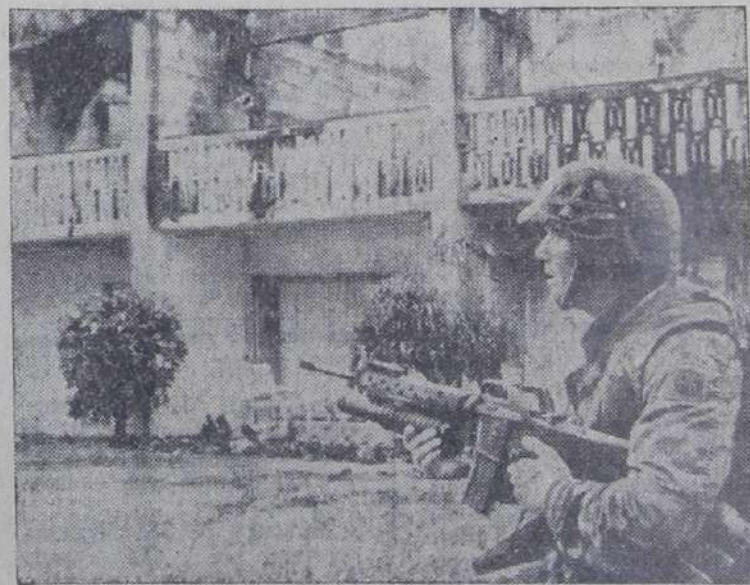
На Гренаде царит атмосфера террора, созданная непрекращающимися арестами представителей прогрессивной общественности, доносами, слежкой и повальными обысками. Все подозрительные, которых арестовывают американские оккупационные войска, отправляются в концентрационный лагерь близ аэропорта Пойнт-Сэйлама. Там сейчас находится около 1300 человек.