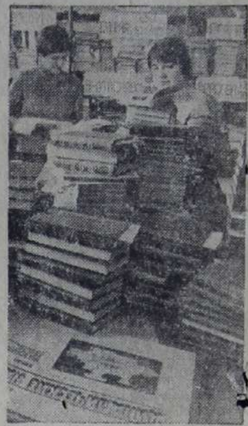
Ленинградское отделение Всесоюзного объединения «Книгоэкспорт» — одно из крупнейших в нашей стране. Отсюда книжная продукция отправляется более чем в сто стран. Это — русская и советская классика, современная проза и поэзия, литература по искусству, науке и технике. Особенно тесные контакты поддерживаются со странами СЭВ. Только в 1983 году в их адрес отправлено более 19 миллионов экземпляров книг на русском языке и на языках братских стран.