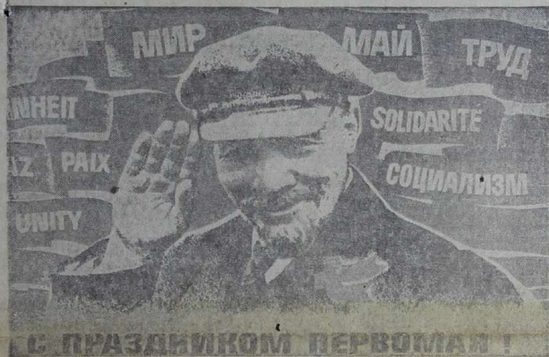
Плакат художника И. Кабына.