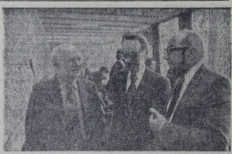
вадуман и спроектирован как крупный исследовательский центр не только этого, но и следующего века