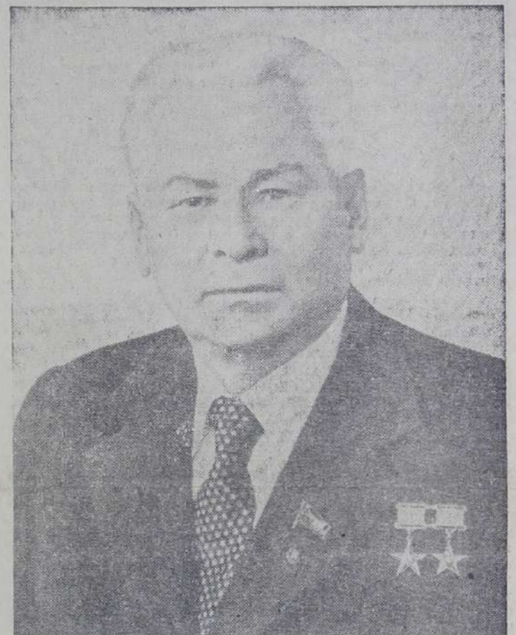
К. У. ЧЕРНЕНКО Генеральный секретарь ЦК КПСС, Председатель Президиума Верховного Совета СССР