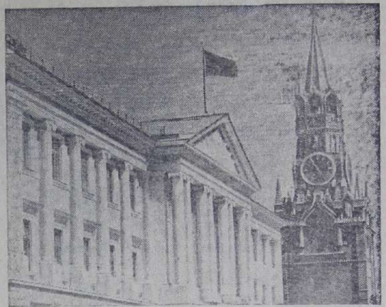
Москва. Здание Президиума Верховного Совета СССР и башня Кремля.

Верховный Совет СССР утвердил Указы Президиума Верховного Совета СССР и принял соответствующие законы.