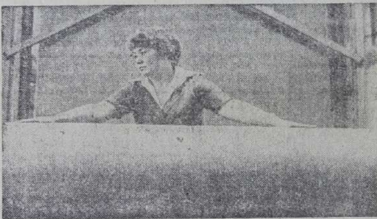
янно наращивает его производство. В минувшем году сверх плана было выпущено более 16 тысяч квадратных метров полотна.

Коллектив фабрики стремится максимально удовлетворить спрос на дорнит, постоянно наращивает его производство. В минувшем году сверх плана было выпущено более 16 тысяч квадратных метров полотна.