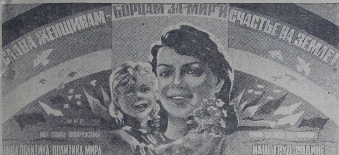
Плакат художников Л. Бельского и В. Потапова.