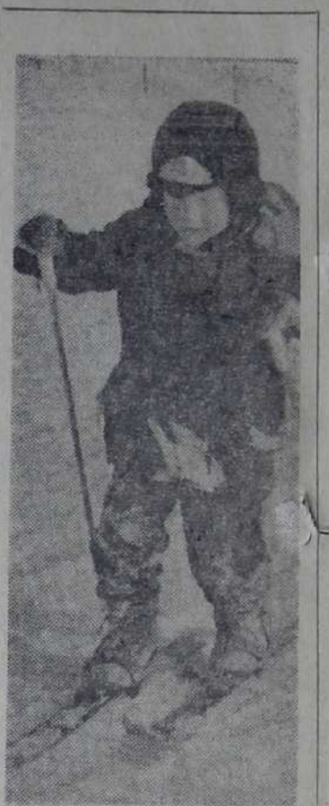
На лыжне.