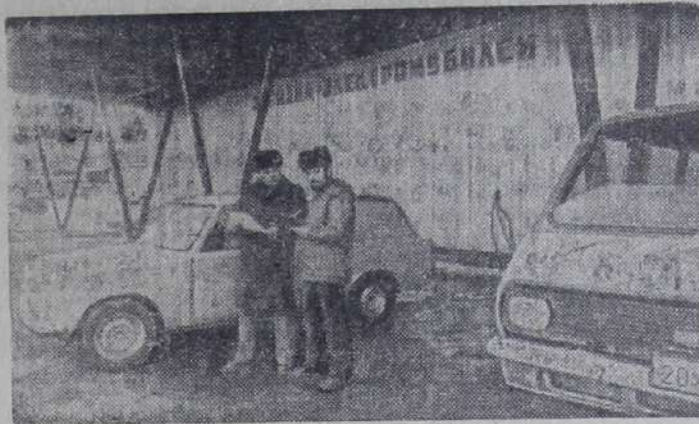
МОСКВА. Голубые «Жигули» плавно трогаются с места и, не оставляя после себя выхлопов, быстро набирают скорость. Причем совершенно бесшумно, хотя у автомобиля

нет привычного глушителя. Это «ВАЗ-2801» — «электрический» первенец Волжского автомобильного завода. Первая партия этих легковых машин с электроводом поступила в опытную эксплуатацию в экспериментальном производственном электромобильном хозяйстве Главмосавтотранса (ЗПЭХ) при автокомбинате № 34.