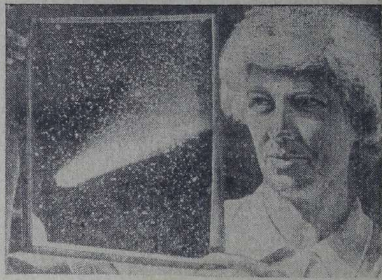
Редактор В. Д. ДЕЛАШИНСКИЙ