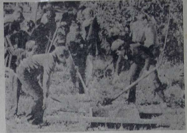
Учащиеся школ активно участвуют в благоустройстве города. Наводят надлежащий порядок на улицах и площадях, в скверах и на территории своих школ. НА СНИМКЕ: учащиеся 5 класса «а» школы № 10 на благоустройстве улиц поселка Сазанлей.

Необходимы общие усилия, чтобы как можно больше людей приближалось к активному и познавательному отдыху, дающему так много для расширения кругозора, укрепления здоровья.