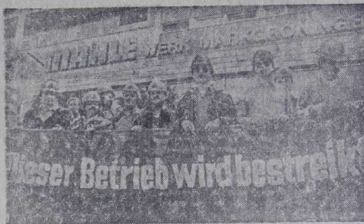
Нарастает классовая борьба в странах капитала, рядовые граждане которых вынуждены вести упорную борьбу за свои насущные интересы, против произвола предпринимателей, в защиту основного права каждого человека — права трудиться и зарабатывать на жизнь. На снимке: «На этом предприятии бастуют» — заявляют рабочие завода в Маркгренингене. В ФРГ, где число безработных составляет около двух миллионов, началось стачечное движение металлургов и печатников.